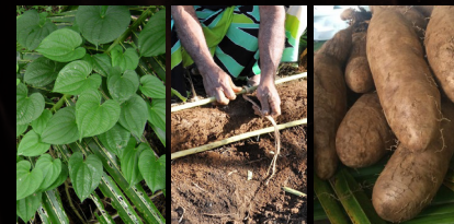
9 Parcelles ignames coutumières

Découvrez les différentes variétés d'arabica.