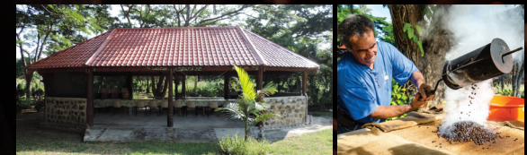
10 à l'ombre du faré ; atelier de dégustation et de torréfaction

De la plantation à la sélection du café vert. Laissez vous guider par l'art de la torréfaction et de la dégustation !