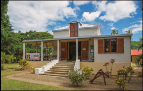
1 Maison Destoop 1

Le site de Camalé est un patrimoine où la mémoire vit sur les traces des bâtis et des colons.