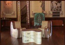
3 Salles d'expositions

Par la suite, la maison "Destoop 2" ainsi que la maison "Debien" sont mises en location et plusieurs locataires se succèdent jusqu'à ce que les bâtisses ne soient plus habitables.