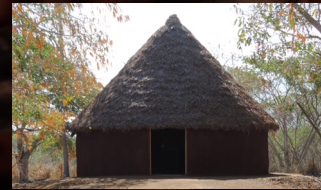
6 La case traditionnelle

Découvrez une collection d'objets anciens, utilisés pour la transformation du café, ainsi que les explications sur leur fonctionnement.