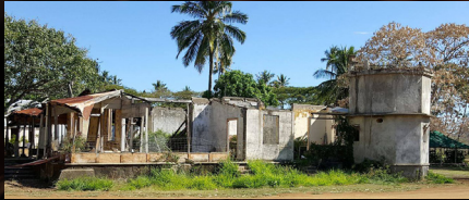
2 Maison Destoop 2

La maison Destoop 1 accueille aujourd'hui l'écomusée avec deux salles d'expositions et une cafétéria.