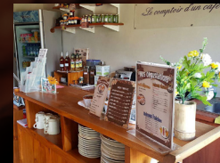
7 La cafétéria, dégustation du café local

Inaugurée en 2017, réalisée par une association de la tribu d'Oundjo, la case traditionnelle est un symbole important de la culture kanak.