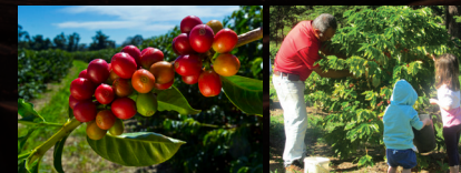
8 Parcelles caféières