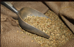
5 L'unité de transformation - Le torréfacteur