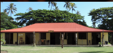
4 Maison Debien

Les expositions explorent des thématiques plus spécifiques liées à la culture du café, d'un point de vue historique, culturel, scientifique ou ethnologique.