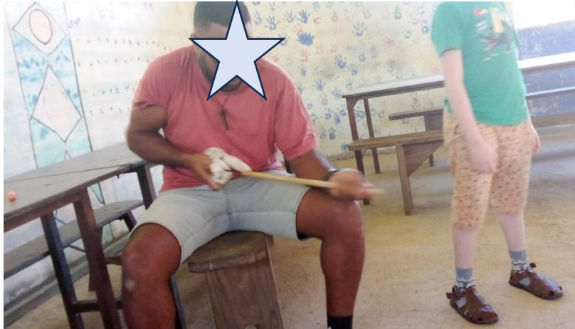
5. Tanyûû nèpwéé-rè ngê bèpè faë döu mêgî.