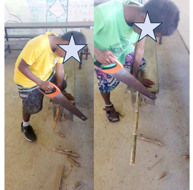
3. Kipuru fawèrè, winâ bachéé nyîbè-rè.