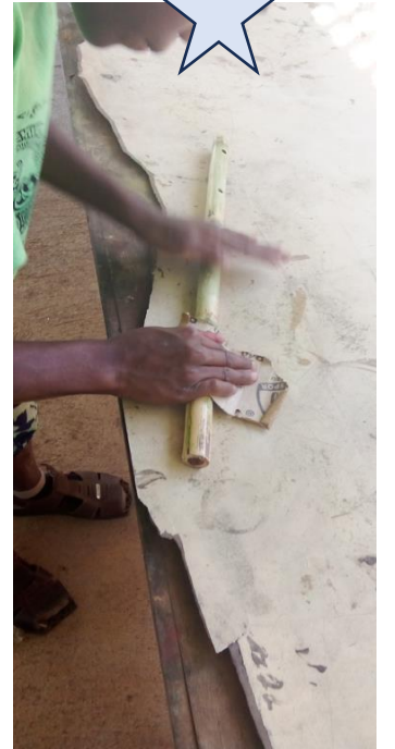
7. Xii xöru bèchöö ngê ‘papier à poncer’.