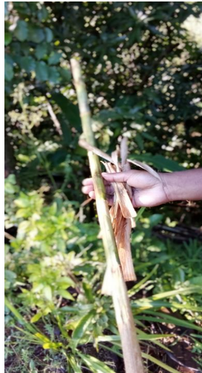
2. Witaa xöru nè-rè.