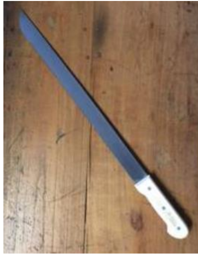
Neamwaa / Neasé