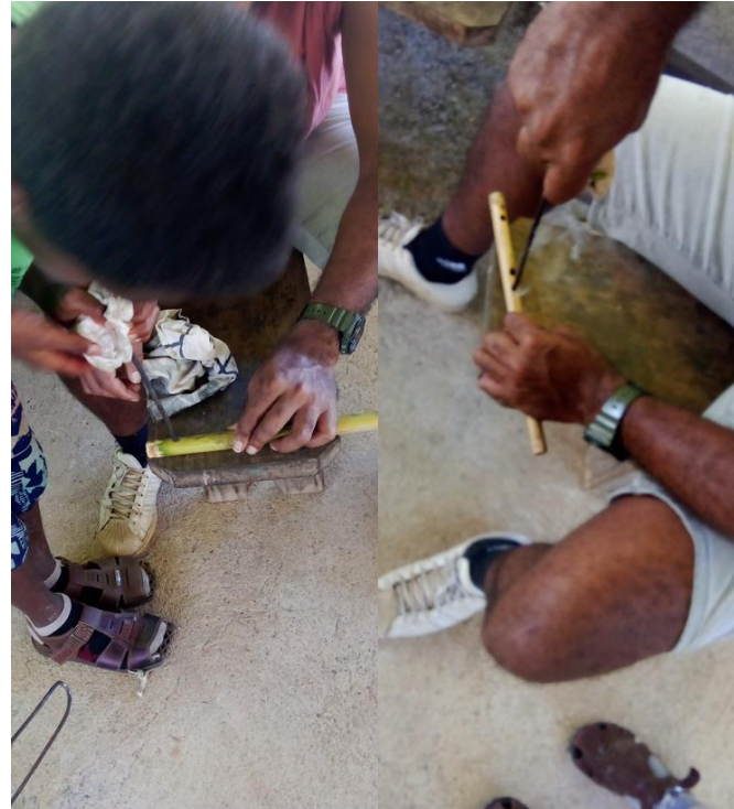
6. Pinyûû bachéé xwâmênyûû rö wâpwéé-rè ngê bèpè faë döu mêgî.