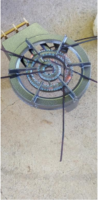
4. Chäfamêgî bèpè faë wâ nè.