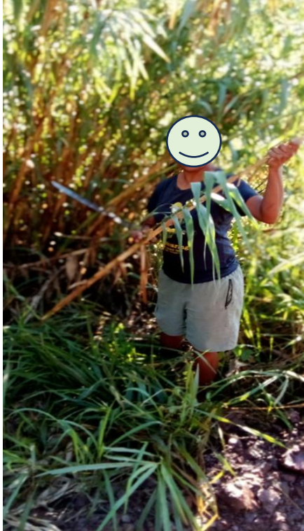
1. Cha mêmê chöö.