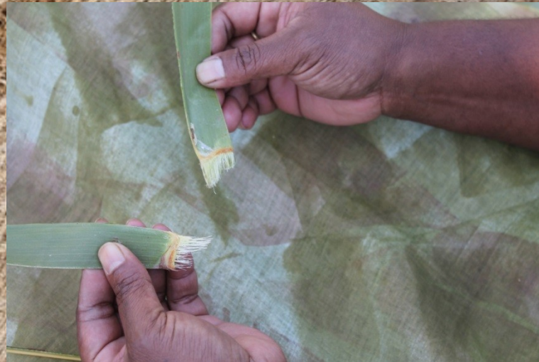
Piinaa itiri du éré dooronû.