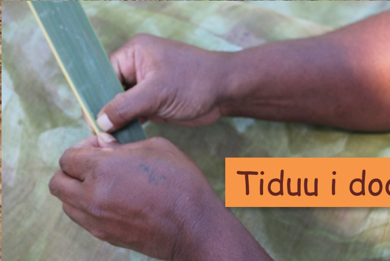
Tiduu i dooronû.