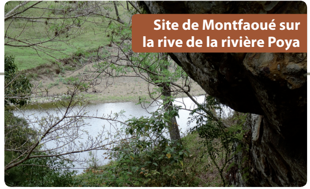
Site de Montfaoué sur la rive de la rivière Poya

au centre géographique de la Grande Terre, les motifs présents seraient à l'origine d'une cartographie du réseau hydrologique. Chaque cours d'eau serait marqué d'un motif dont on retrouverait le double à Montfaoué. L'eau et le minéral seraient intimement liés dans la cosmogonie kanak.